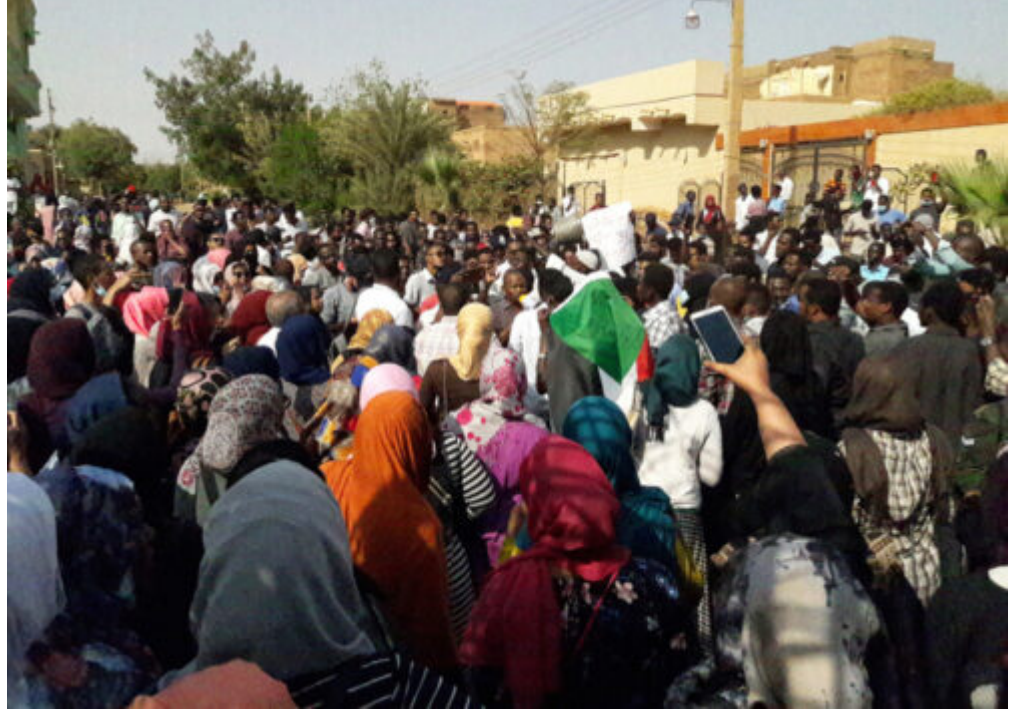
احتجاجات "ذوي السترات الصفراء" السودانيين Read More